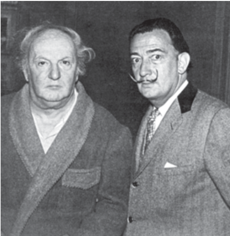
Salvador Dalí visita Pujols a la Torre de les Hores. A la pàgina següent, monument a Pujols davant del Teatre-Museu Dalí de Figueres. A l'última pàgina, portada de Dalí per a "Paris-Match", 26 de juliol de 1969.

en el sentiment poètic, i quan segueix el poble segueix l'orientació de la seva ànima pròpia." Però, com el mateix Pujols reconeixia: "No vaig deixar la poesia, sinó que la poesia em va abandonar a mí".